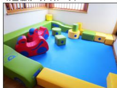
・プレイルーム(子供の遊び場)(イメージ)