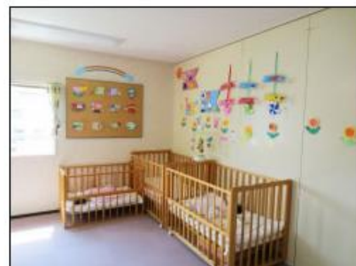
・お昼寝用ベッド(イメージ)