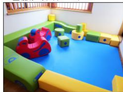
・プレイルーム(子供の遊び場)(イメージ)